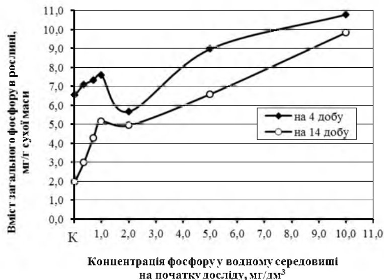
Рис. 1. Динаміка вмісту загального фосфору в N. guadelupensis за різної початкової концентрації фосфору в модельному водному середовищі.

Вивчення впливу концентрації фосфатів у модельному водному середовищі на поглинання фосфору різною дозволило виявити деякі особливості. Так, зокрема, в гострих дослідах через 4 доби експозиції відзначалося збільшення вмісту загального фосфору на 1 г с. м. рослини зі зростанням концентрації фосфору у воді від 0,03(К) до 1,0 \text{мг/дм}^3 , уповільнення його поглинання в інтервалі концентрацій від 1,0 до 2,0 \text{мг/дм}^3 , і подальша активація цього процесу при концентраціях вище 2,0 \text{мг/дм}^3 . Отже, залежність інтенсивності споживання фосфору різною від його концентрації у водному середовищі мала фазовий характер з чергуванням періодів зростання, спаду і знову зростання (рис. 1).