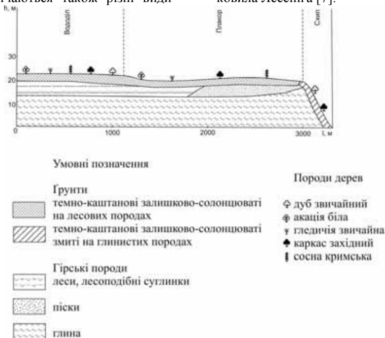
Рис. 2. Висотна диференціація лісокультур Алтагирського лісового масиву

клена (польовий, ясенелистий, татарський) та тополі (бальзамічна, Болле, біла, чорна, пірамідальна), в'яз дрібнолистий, шовковиця біла, шовковиця чорна, глід звичайний – всього близько 150 видів дерев та чагарників. До Червоної книги України занесені цимбохазма дніпровська, астрагал пухнасто-квітковий та ковила Лессінґа [7].