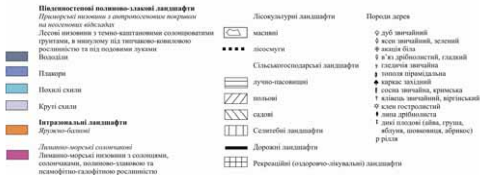
Рис. 1. Сучасна структура лісокультурного ландшафту Алтагірської натурної ділянки

Алтагірський лісовий масив розташований в межах крайнього півдня зони рівнинного Причорноморського сухого степу з темно-каштановими та каштановими солонцюватими ґрунтами [1]. На плакоті ґрунти сформовані на алювіально-делювіальних відкладах з більш