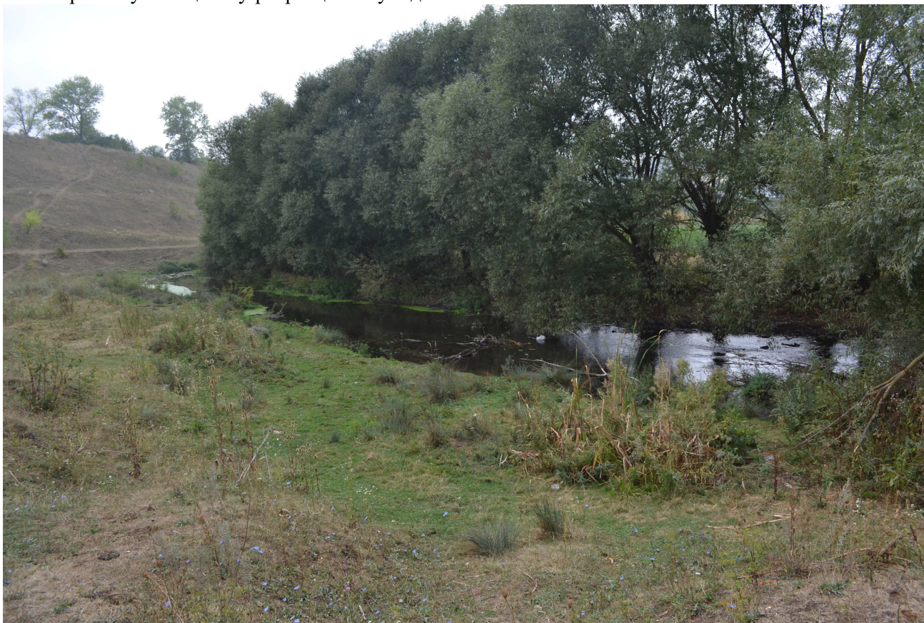
Рис 1. Залуженість річкової долини на верхньому відтинку річкової долини в межах Базарської СР

ношенні ландшафти нижньої частини річково-го басейну для організації відпочинку і оздоровлення населення (рис.3).