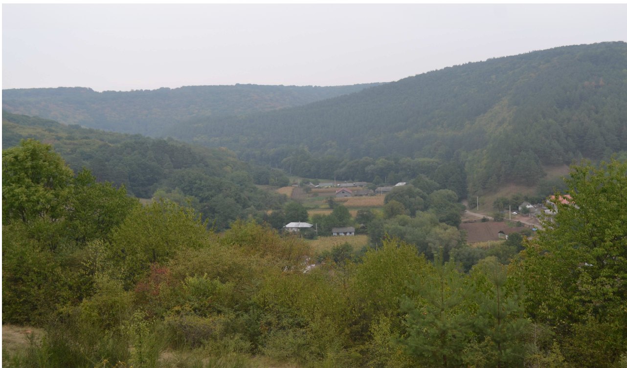
Рис.2. Залісненість річкової долини Джурина у межах Устечківської СР