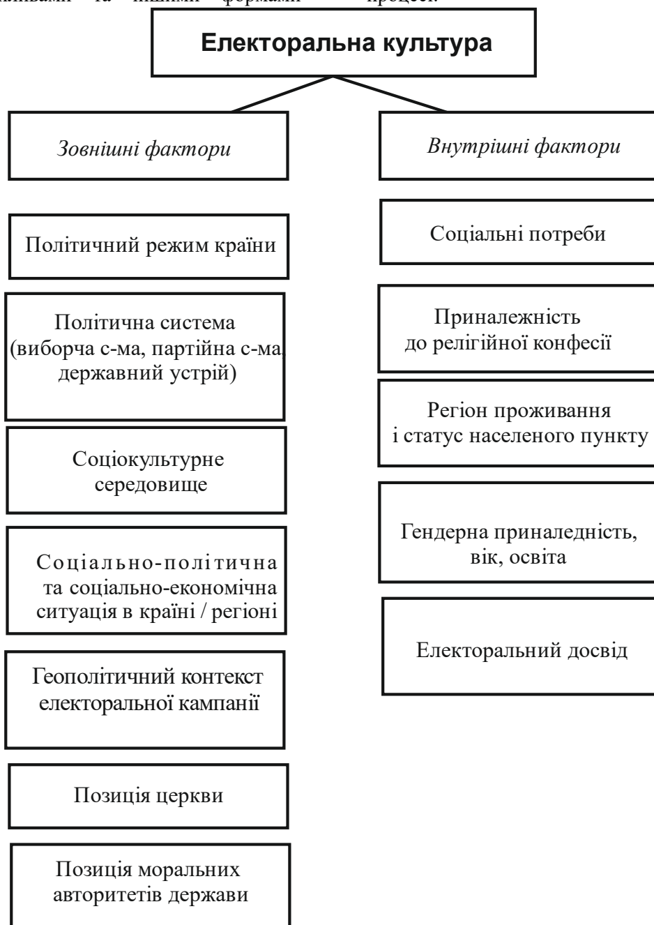
Рис.1. Фактори, що визначають електоральну культуру

сучасної популяризації інформації. Аналіз географії політичної прихильності за тривалий проміжок часу дозволяє твердити, що електоральна культура в розрізі регіонів України ще перебуває в стадії формування, так як спостерігаються значні коливання результатів електоральної прихильності до певних ідеологічних напрямків, показників участі у виборчому процесі.