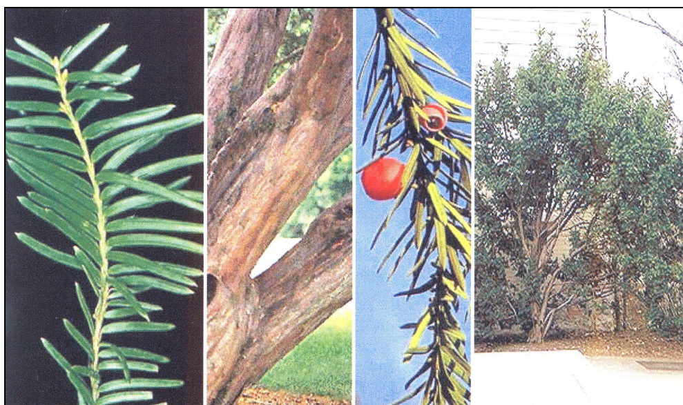
Основні морфологічні ознаки Taxus baccata L.