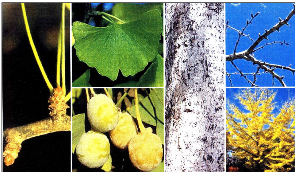
Основні морфологічні ознаки Ginkgo biloba L.

Третій розділ – найбільший за обсягом та найсуттєвіший за вивченням видів відділу Pinophyta (Голонасінні). Він включає дев'ять тем з (№ 8 до № 16). Якщо у перших двох розділах виділено два завдання, то в цих темах — два-три завдання, самостійна робота, література, питання для самоперевірки. Що в цьому розділі справляє особливе враження на читача? Передусім це велика кількість кольорового та чорно-білого ілюстративного матеріалу. На один вид наведено від 8-10 до 18-20 і більше морфологічних ознак. Для підтвердження сказаному наводимо кольорові ілюстрації Ginkgo biloba та Taxus baccata із посібника: