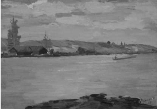
Іл. 4. Д. Шайнога. На річці (Сонячне проміння на воді). 1968 р.

Згадуючи деякі твори, які глядачі побачили вперше (їх надали колекціонери), неможливо не оцінити глибину і ширину, плановість, які охоплені полем зору художника в пейзажі (іл. 4). Відчуття рухливості у композиційній побудові, настроєвості наявні й у натюрмортах, що живуть та дихають барвами і гармонією кольорових плям (іл. 5).