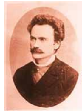
Іван Франко. Фото 1890 р.

Отже, позаминуле століття. На той час Тернопіль/Тарнополь переважно епізодично проникав на сторінки творів, хоча багато їх залишилося в старій пресі, й тут ще можливі відкриття. На щастя, серед тих, хто як репортер і як політичний активіст бував у Тарнополі, а також як письменник черпав враження із цього міста та його околиць для своєї творчості, був Іван Франко. Хто читав оповідання Франка, “спотикався” час-від-часу об Тернопіль (“Чума”, “Свинська конституція” та ін.). Але практично невідомо (принаймні я такого не чув, поки сам до того не дійшов), що Тернопіль – це прототип головного місця дії знаменитих “Перехресних стежок”. Хоч місто й не назване, але описано так, що можна здогадатися, що це не просто “одне з більших провінційальних міст” і повітовий центр. На Тарнополь зразка 1880–1890-х років указують топографія, вулиці, ресторації (як наприклад “Під чорним орлом”). Опис міста, його атмосфери, тогочасної владної еліти і урядовців та частини інтелігенції дають