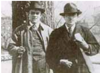
Джон Рід і Боурдмен Робінсон у 1915 р.

Під час Першої світової війни американський репортер і письменник Джон Рід, який спеціалізувався на висвітленні “гарячих” тем, від страйків до революцій, побував і на Східному фронті, зокрема й у фронтовому Тарнополі. Його книжка “Війна у Східній Європі” містить описи Тарнополя в умовах окупації російськими вояками, напередодні їх відступу. Особливо колоритно Рід описав залізничний двірець (вокзал), а також безладдя, біженців, шпигуноманію, розкрадання і хабарництво. Ось перша цитата: “Двірець у Тарнополі перебував у страшному безладі. З довгого військового ешелону, кидаючись за окопом, бігли з чайниками солдати, розбиваючи ряди піхотної колони, котра прямувала до