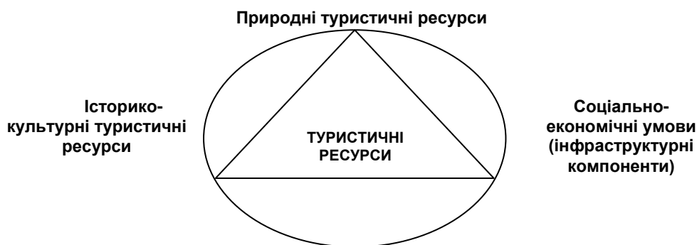
Рис. 1. Основні складові туристичних ресурсів.

Але, на нашу думку, найраціональніший поділ туристичних ресурсів слід робити за професором туризмознавцем О. Бейдиком. Він виділяє 3 основні групи туристичних ресурсів (див. Рис. 1).