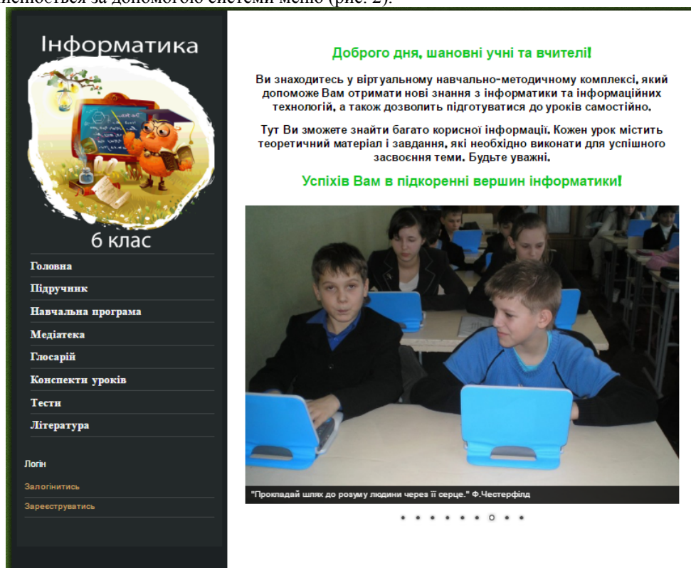
Рис. 2. Головне вікно ЕНМК з інформатики для 6 класу

Комплекс створений як цілком закінчений електронний ресурс та розміщений на web-сайті. Навігація здійснюється за допомогою системи меню (рис. 2).