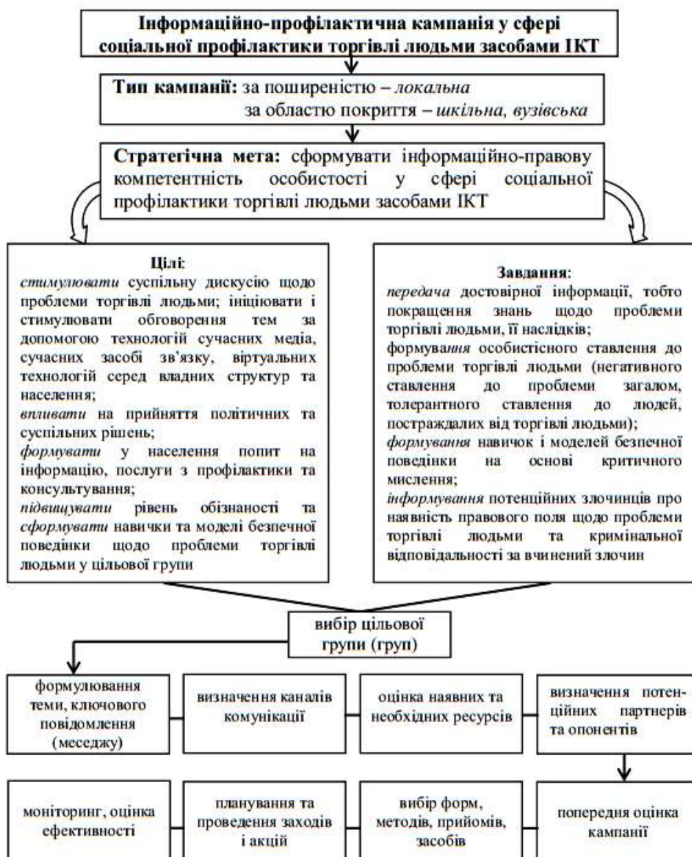
Рис. 2. Матрична модель інформаційно-профілактичної кампанії у сфері соціальної профілактики торгівлі людьми засобами ІКТ

модель інформаційно-профілактичної кампанії у сфері соціальної профілактики торгівлі людьми засобами ІКТ визначено як вихідний еталон, що окреслює шлях реалізації методики, її змістове наповнення (рис. 2).