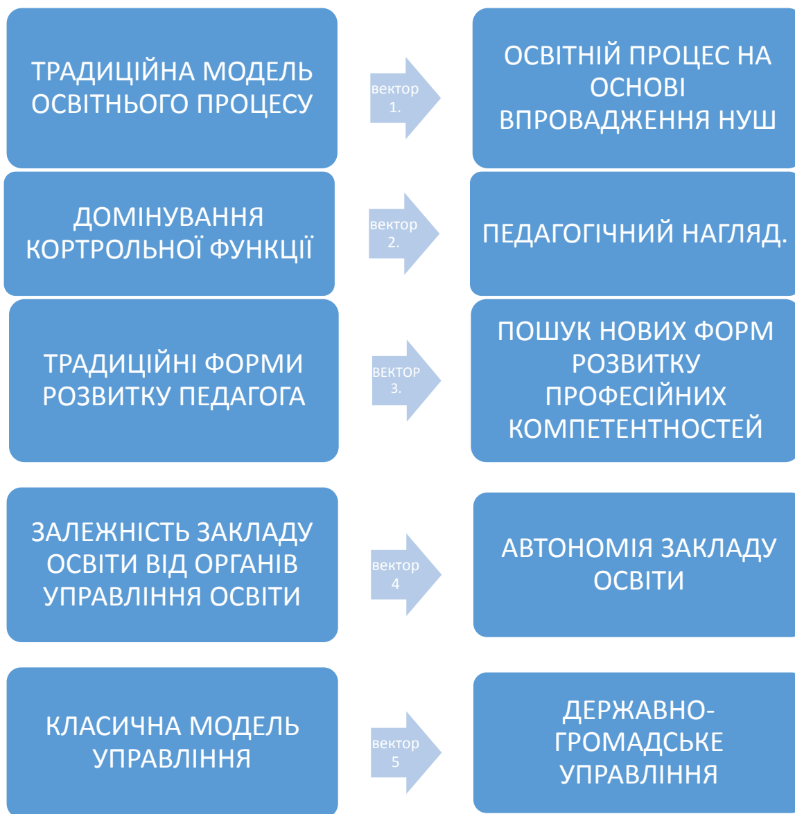
Рис 2. Зміна векторів управління освітнім процесом в закладі загальної середньої освіти.

Висновки. Отже, зміна векторів управління освітнім процесом у закладі середньої освіти зумовлена державною освітньою політикою, новими нормативно-правовими актами, зокрема концепцією Нової української школи та активізацією спільноти щодо запитів на якісну освіту та кісне управління закладом загальної середньої освіти.