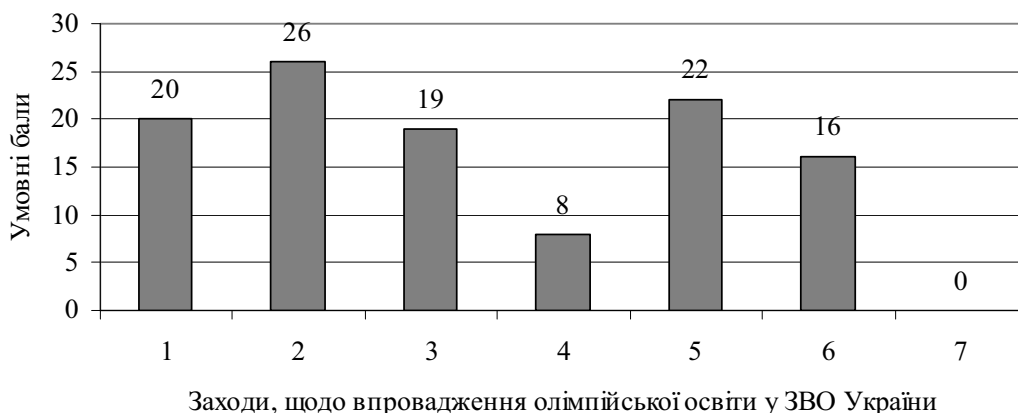
Рис. 1. Заходи з впровадження олімпійської освіти, що проводяться у закладах вищої освіти, де:

олімпійської освіти: участь телепроектах, виступи на радіо (8 умовних балів).