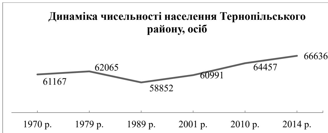
Рис. 1. Динаміка чисельності населення Тернопільського району

поверхні переважають неогенові та кайнозойські відклади. В північній частині проходить Товтрове пасмо з вапняковими вершинами та мальовничим ландшафтом. У південній та південно-східній частинах району у глибоких річкових долинах відкриваються геологічні відслонення із шарами різних епох. Поблизу сіл Білоскірка, Баворів, Лучка розташовані відслонення нижньодевонських (червоного забарвлення) пісковиків і аргілітів. Неповдалік сіл Великий Глибочок і Дубівці височіють горби-останці, які є відрогами Товтровою кряжу, складені переважно з вапняків неогенового періоду. Такі цікаві геологічні об'єкти часто є осередками для розвитку наукового та пізнавального туризму.