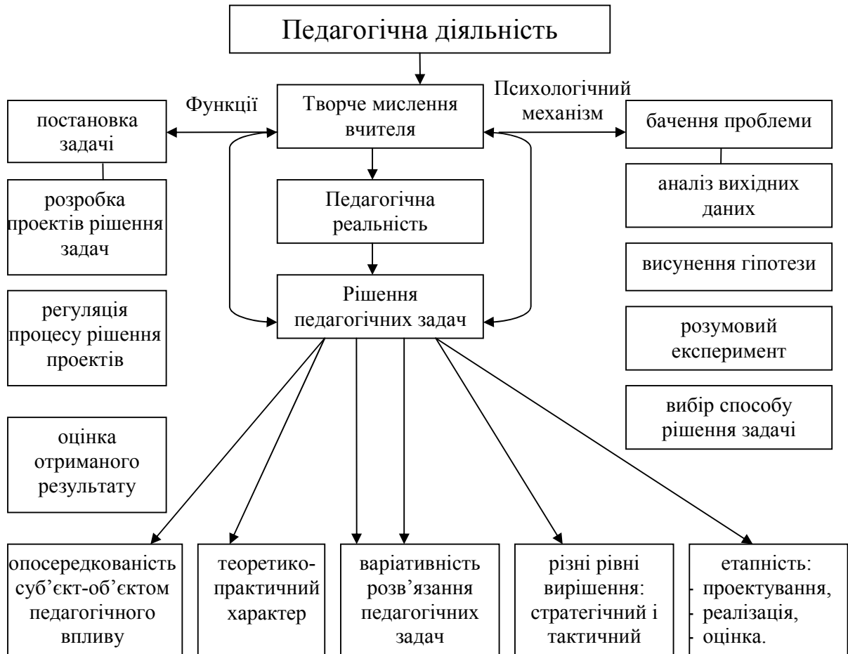
Рис. 1. Структурно-функціональна модель творчого мислення майбутнього вчителя

5) значимість теорії евристичного навчання (А. Хуторської) пов'язана з тим, що ця теорія є теорією розвитку творчих здібностей, які визначають здатність до творчого мислення;