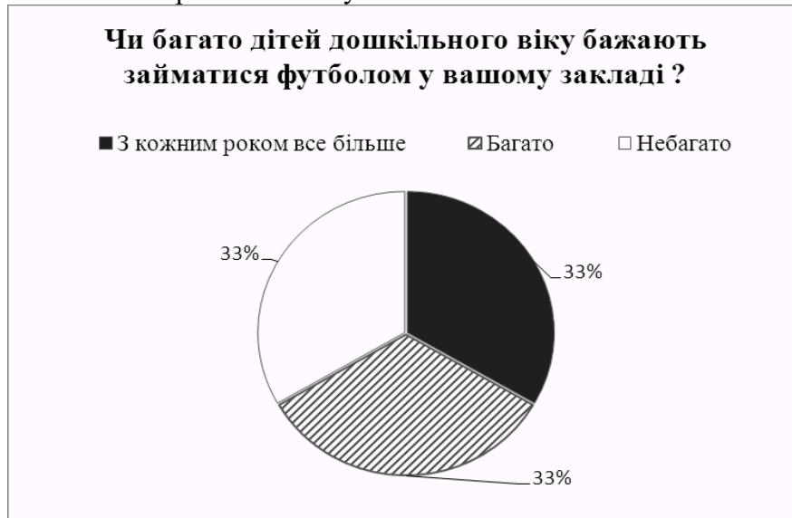
Рис. 1 Аналіз відповідей на запитання анкети «Чи багато дітей дошкільного віку бажають займатися футболом у вашому закладі ?»

Третина респондентів зазначили, що дітей дошкільного віку, що хотіли би займатися футболом, у їхньому регіоні, небагато (Рис. 1). 33 % опитаних відповіли, що бажаючих багато. Ще одна третинна підмітила, що кількість дітей даної вікової групи, що хочуть займатися футболом з кожним роком збільшується.