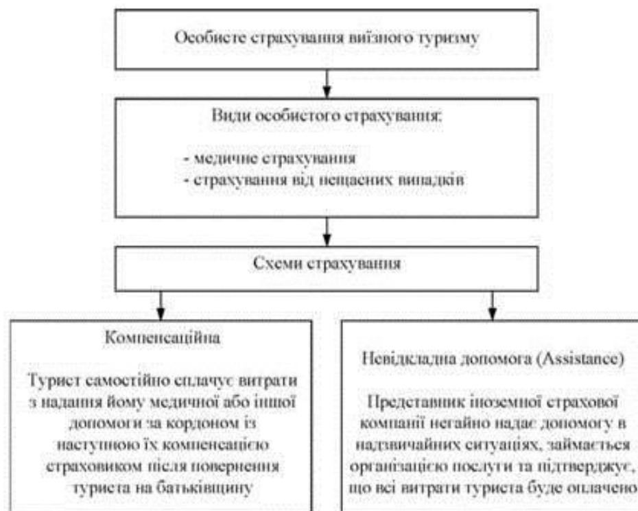
Рис.1. Схема особистого страхування туристів, які виїжджають за кордон

На рис. 1 наведена схема особистого страхування туристів, які виїжджають за кордон [6].