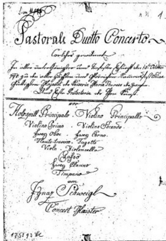
Рис. 8. Титульна сторінка Концерту І Швейгля для скрипки та ксилофона з присвятою австрійській імператриці Марії Терезії. Відень, 1798 р.