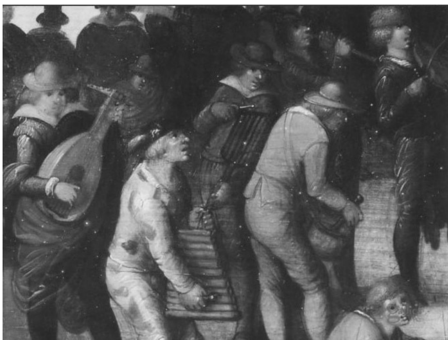
Рис.6. Ксилофоніст у складі міського оркестру. Фландрія, 1604 р.