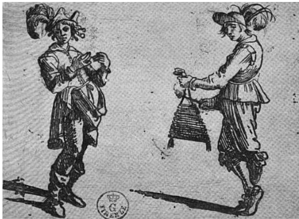
Рис. 1. Флорентійський ксилофоніст. Малюнок Дж. Бранчеллі, 1630 р.