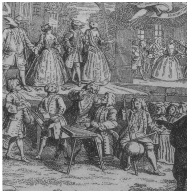
Рис. 4. Ксилофон у складі ансамблю. Фрагмент малюнку-сценографії XVII ст. до іспанської сарсуели Кальдерона де ла Барки «Звір, промінь і камінь».