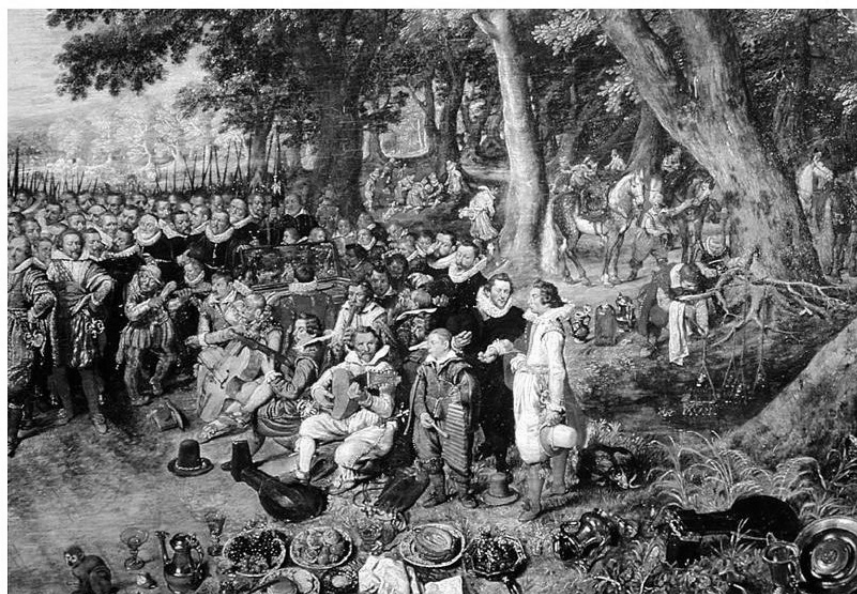
Рис. 5. Виконавець на ксилофоні у складі австрійської дворцевої капели 1616 р.