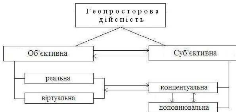
Рис. 2. Логічна модель геопросторової дійсності

фічного, соціально-економічного, геоекологічного, політико-географічного розвитку регіонів і світу загалом тощо. Її об'єктну сферу утворюють також вербальні і візуальні твори мистецтва (література, живопис), у яких відображено Світ у єдності усіх виявів.