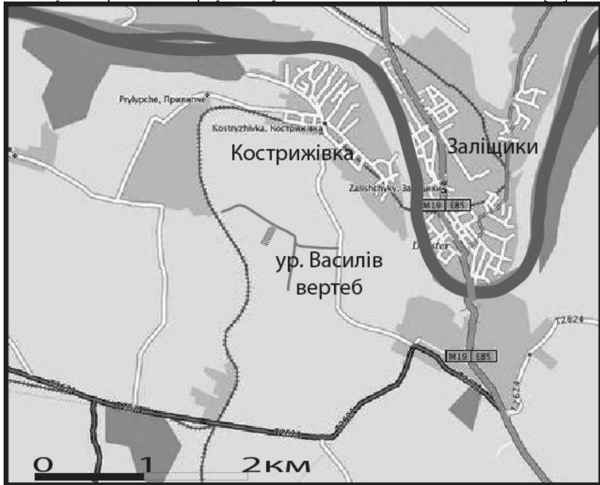
Рис. 1. Розташування урочища “Василів вертеб”

зв'язку із збільшенням щільності рослин та посиленням конкуренції. В цей період протікання сукцесії змінюється з моделі сприяння на модель толерантності. За цією моделлю у фітоценозах збільшується роль видів із вираженими властивостями патентів [11].