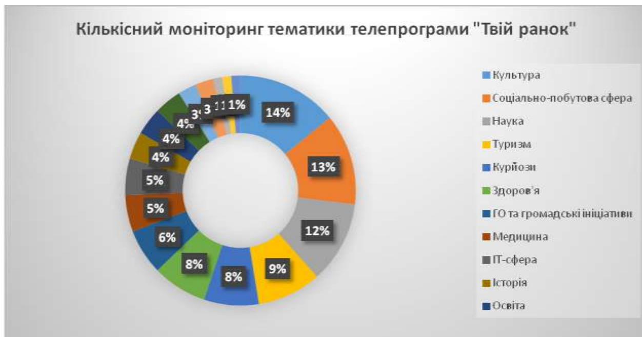
Рис. 2. Співвідношення тем у випусках телепрограми «Твій ранок».

Решту ефірного часу випусків телепрограми «Твій ранок» займають оголошені ведучими новини різного змісту і тематики. Композиційно вони розташовані між традиційними рубриками, згруповані по 3-4 за тематикою або озвучені по одній новині, як бекграунд до основної інформації. Проаналізовані випуски телепрограми всього містили 78 новин (включно з окремими короткими сюжетами, що є складовою імпровізаційності прямого ефіру, хоча завжди підготовані заздалегідь, і приурочені конкретним подіям, вибраним із рубрики «Цей день в історії»). З метою комплексного осмислення тематико-проблемного наповнення випусків аналізованої телепередачі проведено кількісний моніторинг тем (рис. 2).