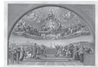
Мал. 9б). Графіка Спір про Св.Причастя, із ориг. Рафаеля, 1850р.