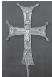
Мал. 7б). Процесійний хрест 1050р., майстер Іоан Діакон, срібло (розм. 75x42)