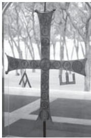
Мал. 6. Хрест для релігійної ходи, Антіохії Віст. Мюнхен, приватна збірка.