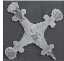
Мал. 5б). Процесійний хрест XV ст.(зворот)., с. Городисько, Львівської обл. зберігається у Львівському музеї народної архітектури та побуту