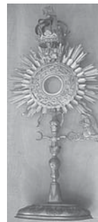
Мал. 11. Дароносиця (монстранція) XIXст. (Зберігається у фондосховищах музею історії релігії м. Львова)