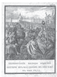
Мал. 4в).Перенесення ікони 1830 р., Літографія (розм. 12,5x17 см)