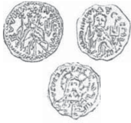
Мал. 1. Київська Русь. Златник Володимира Святославовича 980-1015рр.