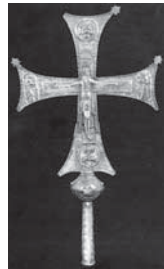
Мал. 7а). Процесійний хрест 994 – 1001рр., майстер Габріель Сапарелі, срібло (розм.80x52см.)