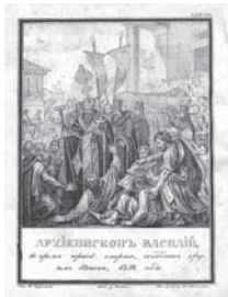
Мал. 4б). Архієпископ Василій 1830 р., Літографія (розм. 12,5x16,5 см)