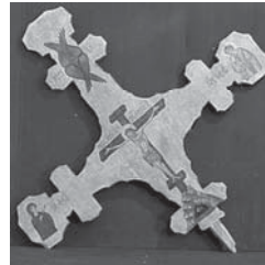
Мал. 5а) Процесійний хрест XV ст., с. Городисько, Львівської обл. зберігається у Львівському музеї народної архітектури та побуту