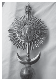
Мал. 10. Патериця XIX ст. монастирської церкви Пресвятої Богородиці, м. Тисменниця, Івано-Франківської обл.