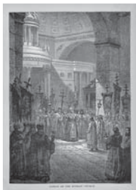
Мал. 4а). Руське духовенство. Гравюра на дереві 1880 (розм. 11x18)