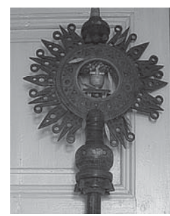
Мал. 12. Патериця XX ст., Коломийського музею народного мистецтва Гуцульщини і Покуття