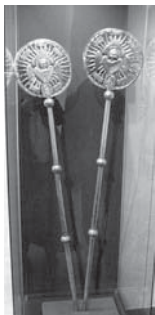
Мал. 8а). Рипіди, Кирило-Білозерського монастиря