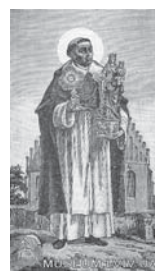
Мал. 9а).Гравюра св Гаяинт Одровонж (1183 - 1257)