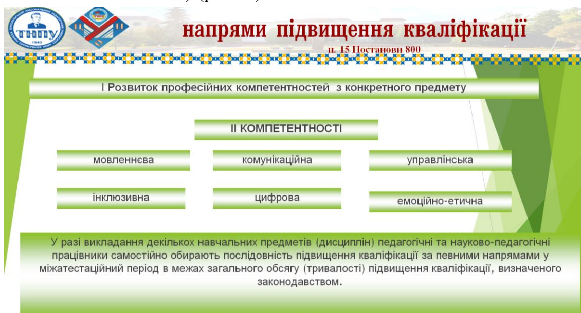
Рис. 1. Напрями підвищення кваліфікації, які впроваджуються у ЦПО ТНПУ ім. В. Гнатюка

2) формування у здобувачів освіти спільних для ключових компетентностей вмінь, визначених у статті 12 Закону України «Про освіту» (мовленнєва, цифрова, комунікаційна, інклюзивна, емоційно-етична компетентність) (рис. 1).