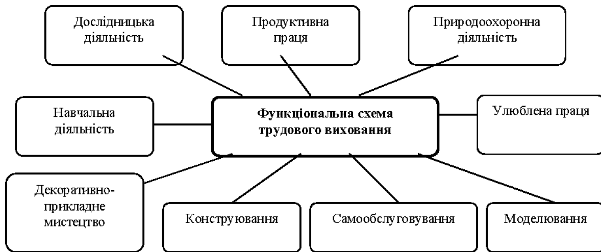
Рис. 3. Функціональна схема трудового виховання

Функціональна система трудового виховання учнів, на основі праць В.Сухомлинського, може бути запропонована у наступному вигляді (рис.3).