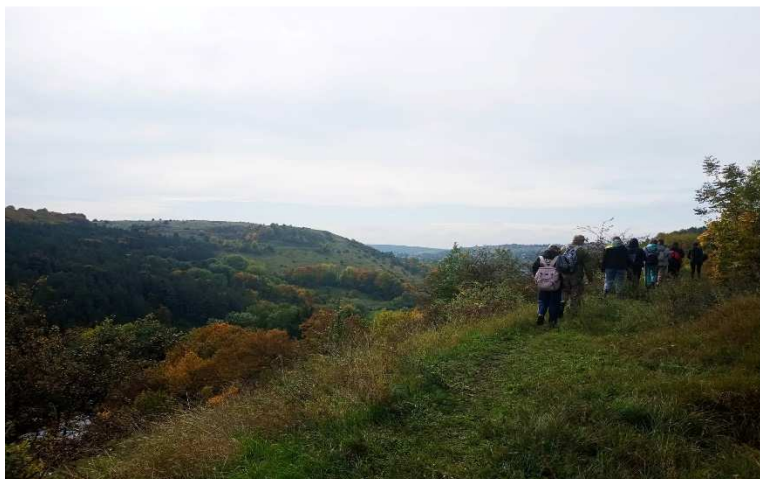
Рис 1. Вид на Замкову гору

фортеці на протилежному боці річки Гнізни височить таємнича Бабина гора, про яку існує багато легенд [1, 36-39].