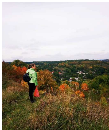
Рис 2. Вид на Бабину та Довбушеву гори

Окремою туристичною локацією є гора Довбуша – товтрова гора біля села Залужжя, розташована на лівому березі річки Гнізна, обіч Бабиної Гори (сполучені між собою), висота – 405 метрів. Про зв'язок назви з іменем Олекси Довбуша відомостей немає, а у Збаражі назву трактують від родини братів Шмигельських, які проживали коло гори – в народі їх називали Довбушами. Саме на північних схилах цієї гори розташовані печери, які й ідентифіковані із залишками язичницького святилища. Печери мають два входи, які знаходяться на правому березі одного з витоків річки Гнізна (приблизно 1 км до річки), і вище рівня річки на