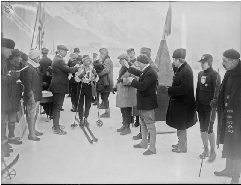
Фото 1. Степан Гевак стартує на Олімпійських іграх у Шамоні (Франція, 1924 рік).

На III Олімпіаді в Лейк-Плесіді (США) виступило четверо українців з Польщі. Вони представляли Польщу у хокеї на льоду: Адам Ковальський (народився в Івано-Франківську), Володимир Крігер (народився у Дніпропетровську), Роман Сабинський (народився у Львові), Казимир Соколовський (народився у Львові). Їх команда посіла 4 місце. А також Валентин Білас: 5-е в бігу на ковзанах на дистанції 10000 м.