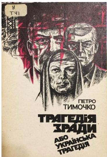
Іл. 3. Обкладинка книги Петра Тимочка «Трагедія зради або українська трагедія», 1992 р.