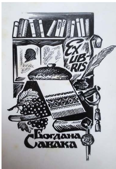
Іл. 2. Екслібрис Богдана Савака