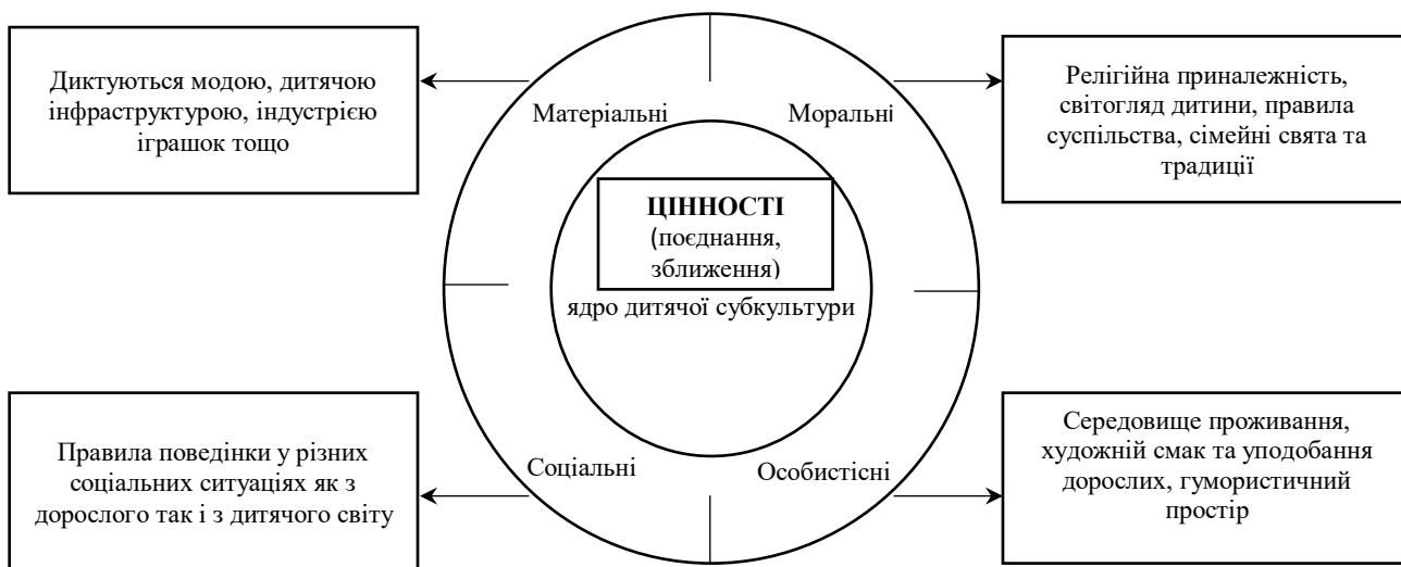
Рис. 3 Аксіологічне ядро дитячої субкультури

На рис. 3 представлено ціннісне ядро дитячої субкультури. Зокрема розкрито матеріальні, соціальні, особистісні та моральні аспекти аксіологічного ядра.