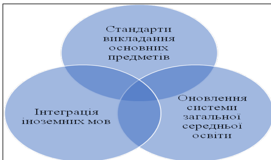
Рис. 2. Основні аспекти реформ в освітній галузі

Іноземна мова в сучасній освіті стала однією з пріоритетних галузей не тільки в Україні, але й у всьому європейському контексті. Концепція нової Європи, що не має кордонів та розширює сфери міжнаціонального співробітництва, вимагає акцентуації уваги на навчанні іноземних мов. Їх знання відкриває шлях до європейської інтеграції та є необхідним засобом забезпечення демократичної стабільності. Основні аспекти сучасної мовної політики в Європі визначені в Рекомендаціях Комітету Міністрів Ради Європи щодо сучасних мов. Тут відзначено, що знання іноземної мови, навіть на елементарному рівні, відкриває можливості для особистої мобільності, працевлаштування, освіти та широкого доступу до інформації 100 .