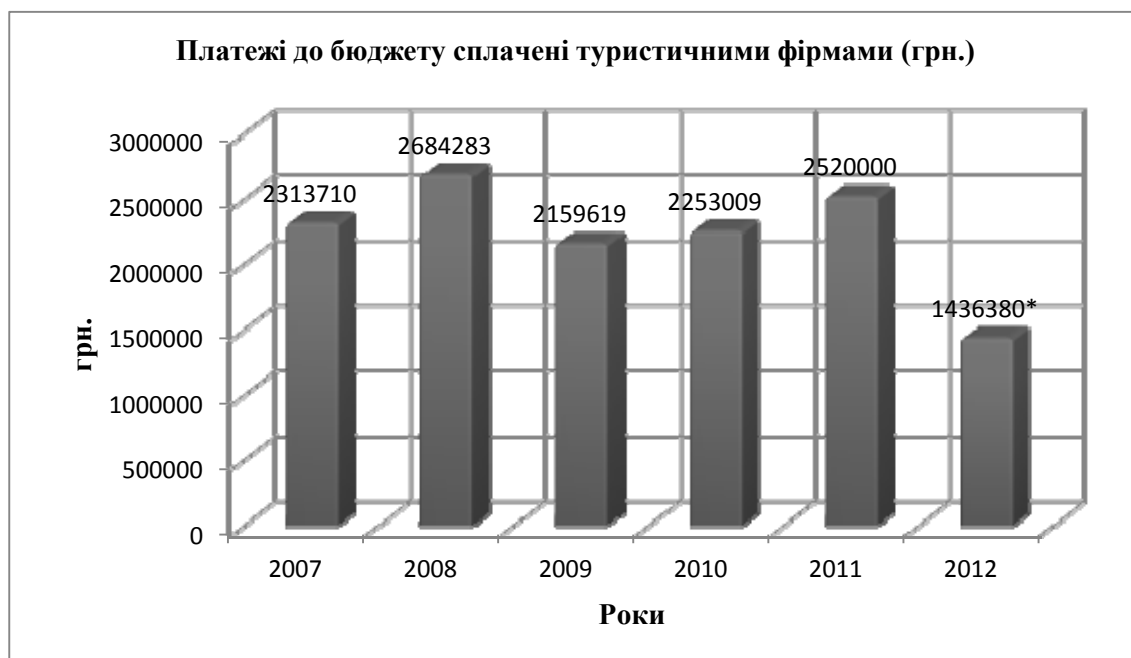
Рис.2. Динаміка внутрішніх туристичних потоків

* - у 2012 році, у зв'язку із відміною турагентської ліцензії, змінилась база порівняння. Так у 2011 році звітність подавали 117 суб'єктів господарювання – ліцензіатів (турагентів та туроператорів), то у 2012 році всього 32 туроператори [14].