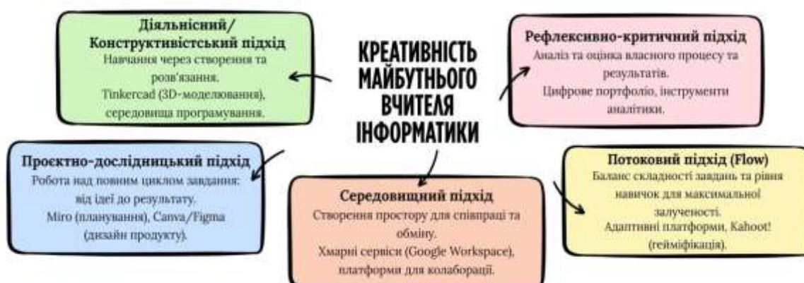
Рис. 1. Теоретичні підходи до розвитку креативності майбутніх учителів інформатики (розроблено автором)

Аналіз теоретичних джерел дає змогу виокремити основні підходи до розвитку креативності майбутніх учителів інформатики. Взаємозв'язок і характеристику цих підходів подано на рис. 1.