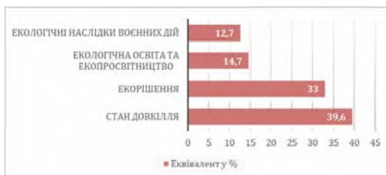
Рис. 2. Тематичний спектр матеріалів про екологію