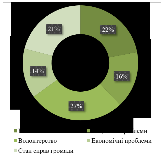
Рис. 2. Результати аналізу новинного контенту телерадіокомпанії РАІ (за період 01.01.2023 – 31.12.2023), %

Кількісний аналіз новинних сюжетів телерадіокомпанії РАІ впродовж 2023 року продемонстрував пріоритетність висвітлення соціальної проблематики краю. Це свідчить про те, що регіональне медіа, попри помітне розширення географії новин, все ще оперативно й детально інформує громаду про зміни в житті Івано-Франківська та області (рис. 2).