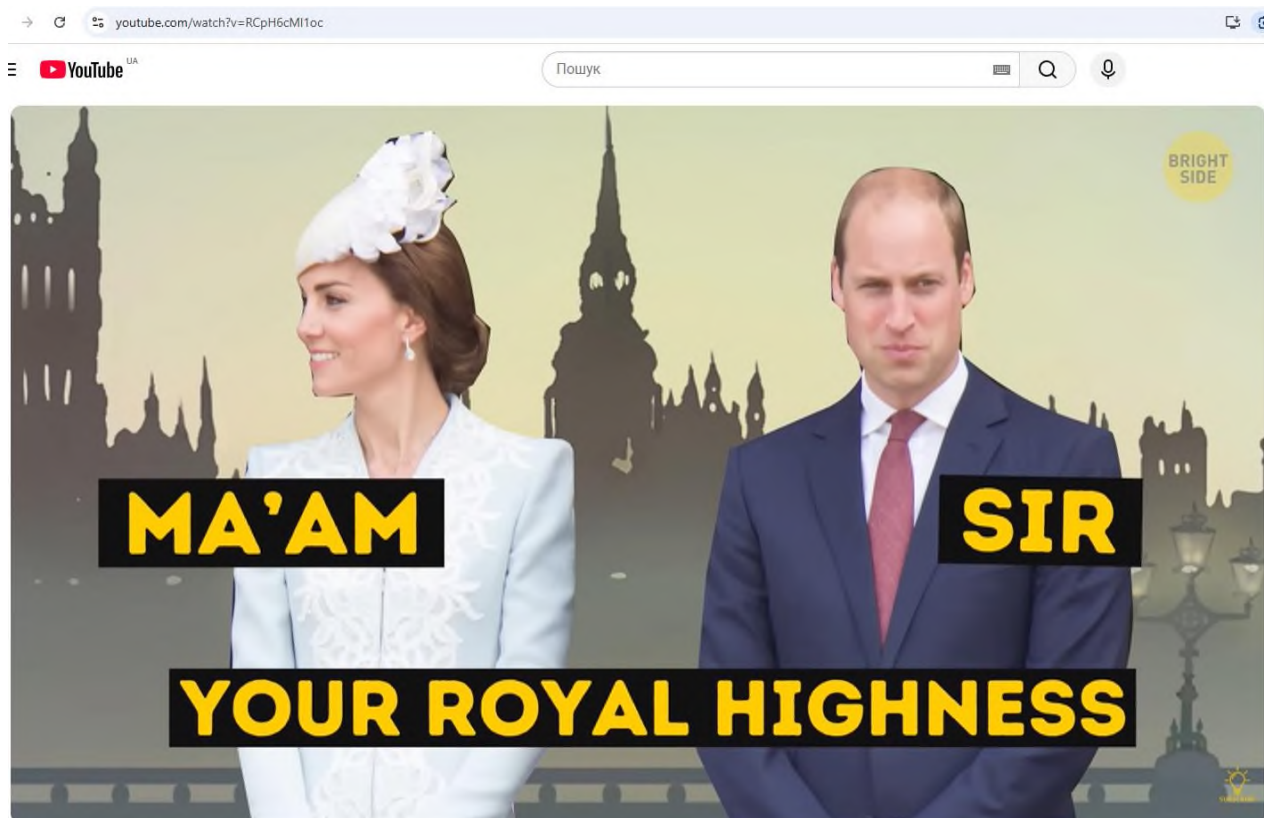
9 Things No One Can Do When Meeting the Queen

Рис.1 Скріншот відео 9 Things No One Can Do When Meeting the Queen