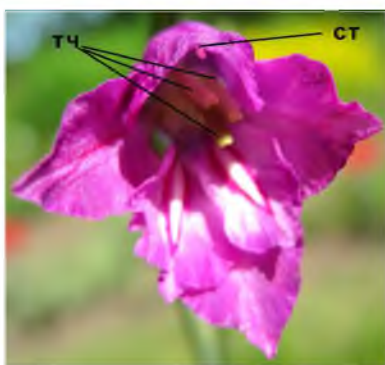
Рис. 1. Зовнішній вигляд квітки Gladiolus imbricatus L. у перший день цвітіння: СТ – стовпчик, ТЧ – тичинки

З порядком зацвітання квіток в суцвітті змінюється розмір їх оцвітини і забарвлення, так що останні квітки в суцвітті мають значно менші розміри всіх листочків оцвітини (табл. 1) і є значно світлішими, ніж перші квітки.