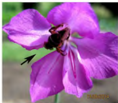
Рис. 2. Мелітофілія в Gladiolus imbricatus L. (стрілкою позначено редукований внутрішній листочок оцвітини з вказівником нектару)

За нашими спостереженнями, квітку G. imbricatus відвідували лише бджоли Apis mellifera Linnaeus (рис. 2). Упродовж цвітіння запилювачі можуть відвідувати одну і ту саму квітку по декілька разів. Спочатку бджола відвідує нижню квітку суцвіття, а потім – усі наступні квітучі квітки у суцвітті, після чого перелітає на квітки сусідніх особин.