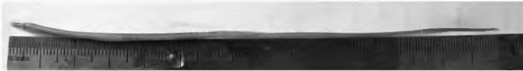
Acipenser gueldenstaedtii Brandt & Ratzeburg, 1833 (в центре)