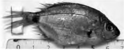
Diplodus annularis (Linnaeus, 1758)