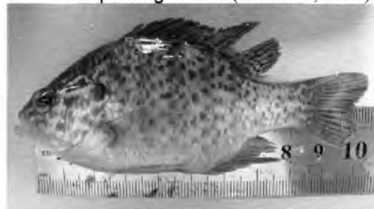
Рис. 1. Новые виды рыб прибрежных вод о. Змеиный, обнаруженные в 2012-2014 гг.

Две особи Diplodus annularis (Linnaeus, 1758) были впервые выловлены в прибрежных водах с северной стороны острова Змеиный в декабре 2012 года. Еще 2 особи этого вида рыбы (общая длина 7,8 и 10,5 см, масса – 8,0 и 20,9 г соответственно) были обнаружены в сетях в мае 2014 г. В октябре этого же года три особи ласкиря были отмечены визуально на глубине 15 м во время проведения подводных исследований с северной стороны острова. Это придонный, морской, теплолюбивый вид. Растет быстро, половой зрелости достигает к 2-3 годам. Нерест происходит с мая по сентябрь. Плодовитость до 806,0 тыс. икринок, икрометание порционное, икра пелагическая. Питается как растительной, так и животной пищей, преимущественно, ракообразными, полихетами, моллюсками [1].