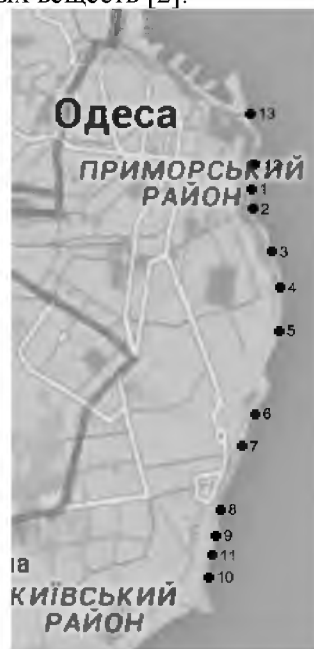
Рис. 1. Расположение выпусков дренажных и ливневых вод на побережье г. Одессы

Схема выпусков дренажных и ливневых вод приведена на рисунке 1. Пробы дренажных и ливневых вод отбирали 13 августа 2014 г. и доставляли в лабораторию, где определяли в них содержание загрязняющих и биогенных веществ [2].