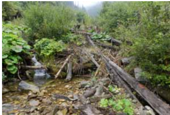
Захарщення долини потоку