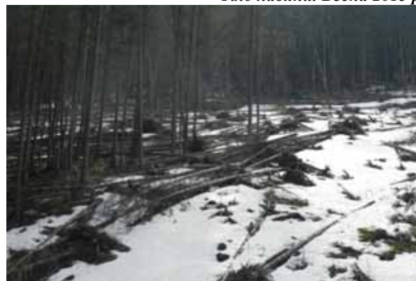
Межа зони акумуляції лавинного ПТК