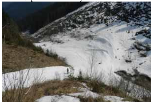
Тіло лавини. Весна 2013 р.