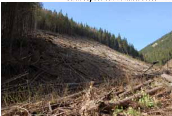
Зона акумуляції лавинного ПТК. Весна 2010 р.