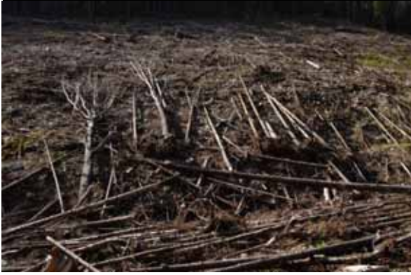
Зламани дерева в нижній частині зони акумуляції