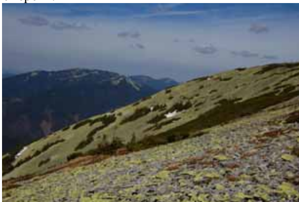
Зона зародження лавинного ПТК

Нижні ділянки зони транзиту снігових мас зайняті, здебільшого, доволі різноманітною рослинністю. У різнорозмірних, переважно невеликих (до 150–200 м 2 ), біогрупах поширені представники усіх вищеразміщених частин лавинних ПТК. Це фрагменти низькорослих хвойних і листяних дерев, криволісся, чагарників і чагарничків, субальпійських і різнотравних луків. В межах модельної ділянки "Грофа" дещо припіднята центральна частина лавинного лотка зайнята "острівками" жерепу, які чергуються із смугами греготів. Кам'яні розщипиця рясно встелені сухими гілками. У свою