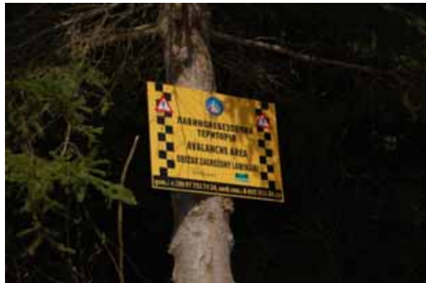
Попередження на туристичному маршруті