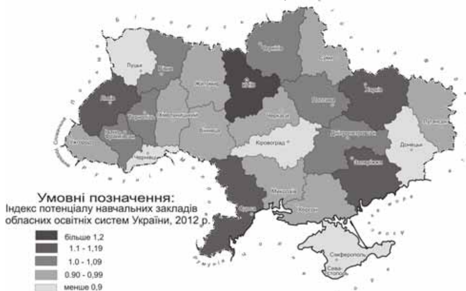
Рис. 4. Індекс потенціалу закладів освіти ООС України, 2012 р.

місця в цих групах належить регіонам, де міста-обласні центри є найбільшими економічними, історично-культурними і освітніми центрами країни. Це Дніпропетровська, Запорізька, Львівська, Одеська, Харківська ООС.