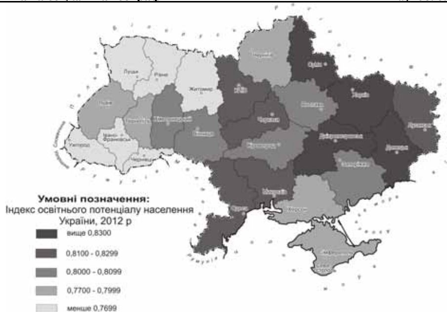
Рис 1. Індекс освітнього потенціалу населення України, 2012 р.

Згідно національних стандартів й норм, ООС контролюють і забезпечують повний базовий спектр організації послуг загальноосвітнього навчально-виховного процесу включно із програмами компенсуючого і реабілітаційного розвитку дітей дошкільного і шкільного віку. На рівні обласних департаментів освіти координуються програми позашкільного навчально-виховного процесу Центрів дитячої та юнацької творчості, Дитячо-юнацьких спортивних шкіл, Малої академії наук та інших закладів, залучення обдарованої шкільної молоді області до пошуково-наукової роботи з науковцями ВНЗ.