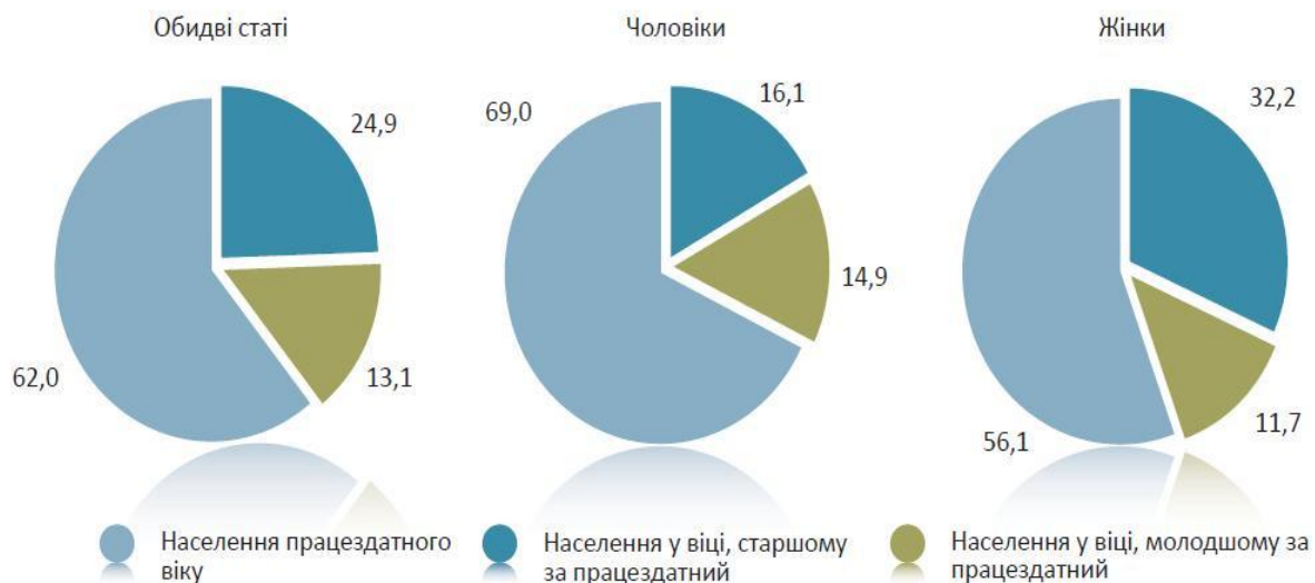
Рис.3. Населення працездатного і непрацездатного віку, 2011 рік, %

У 2011 році частка населення працездатного віку становила 62,0% (617 847 осіб), молодшого за працездатний вік, – 13,1% (130 966 осіб), старшого за працездатний вік, – 24,9% (248 265 осіб). При цьому, якщо серед чоловіків кількість населення у віці, старшому за працездатний, була лише дещо більшою за кількість населення у віці, молодшому за працездатний, то серед жінок кількість осіб у віці, старшому за працездатний, у 2,75 разів перевищувала кількість осіб у віці, молодшому за працездатний (рис. 3). Такий дисбаланс пояснюється більш ранньою межею непрацездатного віку для жінок. Водночас, якщо поррахувати частку чоловічого населення у віці, старшому за працездатний використовуючи таку ж межу пенсійного віку, як і для жінок (55 років і старше), то жіноче населення у віці, старшому за працездатний, все одно буде у 1,6 разів більше, ніж чоловіче, через більшу тривалість життя жінок [1, с. 18].