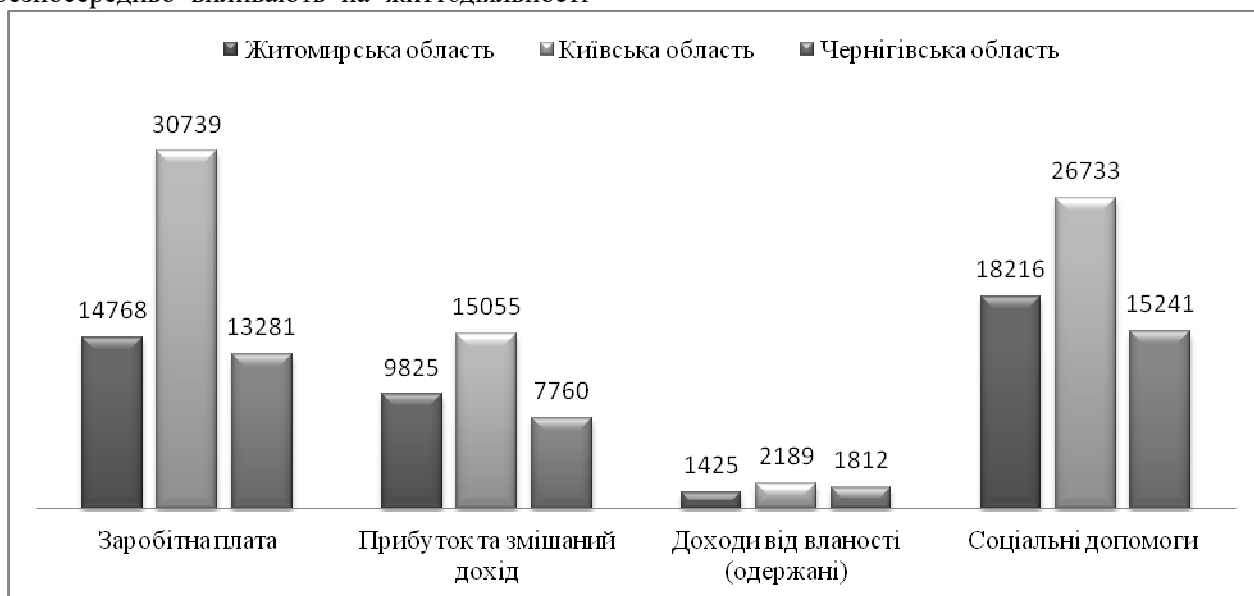
Рис. 1. Структура доходів населення Столичного макрорайону України у 2015 році * *узагальнено та систематизовано автором за статистичними даними [6;7;8]

З огляду на вище зазначені фактори для визначення нерівності в межах регіонів, представимо детальніше економічні показники. У цьому випадку стає необхідним встановлення пріоритетів при проведенні оцінки виділених параметрів, встановлення характеру їх впливу на формування середнього класу. У зв'язку з цим вибір пріоритетних факторів впливу на формування середнього класу є вкрай актуальним. Отже, представимо структуру доходів витрат та заощаджень населення Столичного макрорайону України у 2015 році (рис.1).