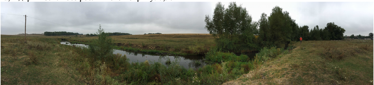
Рис.5. Заплавні луки в межах річкової долини Джурин.

Отже, в басейні річки Джурин, в районі сільських рад Чортківського району Тернопільської області ми спостерігаємо, що під земельними ділянками, які систематично обробляються і використовуються під посіви сільськогосподарських культур, тобто ріллею залучено від 78% до 87%; під луками знаходиться 8% - 12% земель, ліси займають в межах одного відсотка території, що свідчить про вкрай розбалансовану структуру землекористування ( частка земельних угідь під природною рослинністю складає всього 10-15%) (рис.5.)[3].