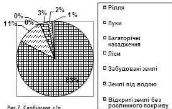
Рис.7. Слобідська с/р

Площа земельних угідь: 1062,00 га, рілля: 854,45 га, багаторічні насадження: 1,00 га, лісові ресурси: - га, забудовані землі 33,00га, відкриті землі без рослинного покриву: 13,00 га, землі під водою: 18,00 га (рис.7).