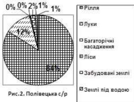
Рис.2. Полівецька с/р

Площа земельних угідь: 2687,40 га, рілля: 2205,30 га, багаторічні насадження: - га, лісові ресурси: 12,39 га, забудовані землі 55,77 га, відкриті землі без рослинного покриву: 13,00 га, землі під водою: 22,70 га (рис.2)