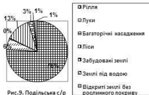
Рис.9. Подільська с/р

Площа земельних угідь: 3276,00 га, рілля: 2450,57 га, багаторічні насадження: 9,00 га, лісові ресурси: 423,00 га, забудовані землі 83,36 га, відкриті землі без рослинного покриву: 42,12га, землі під водою: 20,00га (рис.9).