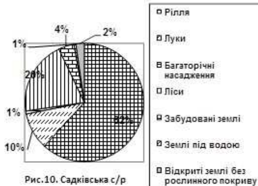
Рис.10. Садківська с/р

Площа земельних угідь: 1445,00 га, рілля: 866,41 га, багаторічні насадження: 11,36 га, лісові ресурси: 284,00 га, забудовані землі 59,38 га, відкриті землі без рослинного покриву: 32,20 га, землі під водою: 6,00 га (рис.10).