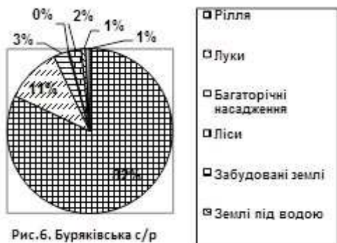
Рис.6. Буряківська с/р

Площа земельних угідь: 1922,00 га, рілля: 1542,40 га, багаторічні насадження: 53,90 га, лісові ресурси: 4,57 га, забудовані землі 44,21 га, відкриті землі без рослинного покриву: 16,30 га, землі під водою: 15,26 га (рис.6)