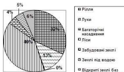
Рис.12. Устечківська с/р

них сміттєзвалищ і складуванням органічних відходів, які є основними джерелами побутового забруднення (рис.13) [5].