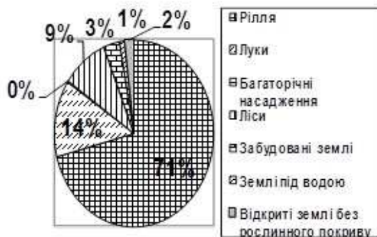
Рис.8. Кошилівська с/р

1471,71 га, багаторічні насадження: 5,22 га, лісові ресурси: 192,10 га, забудовані землі 67,75 га, відкриті землі без рослинного покриву: 39,80 га, землі під водою: 13,19 га (рис.8).