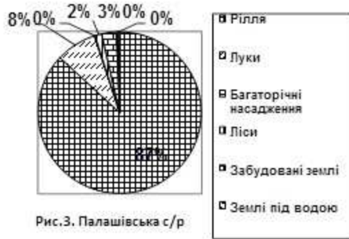
Рис.3. Палашівська с/р