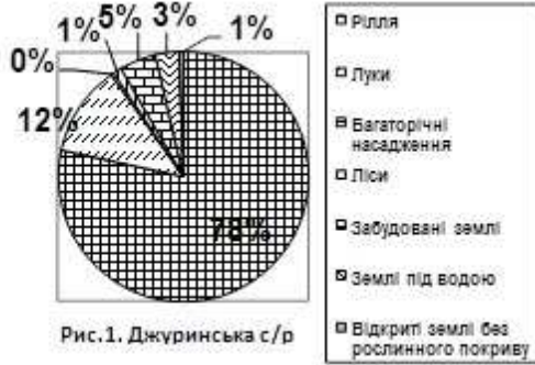
Рис.1. Джуринська с/р

Площа земельних угідь: 3001,70 га, рілля: 2280,75 га, багаторічні насадження: 11,00 га, лісові ресурси: 32,60 га, забудовані землі 136,82 га, відкриті землі без рослинного покриву: 16,70 га, землі під водою: 89,26 га (рис.1).