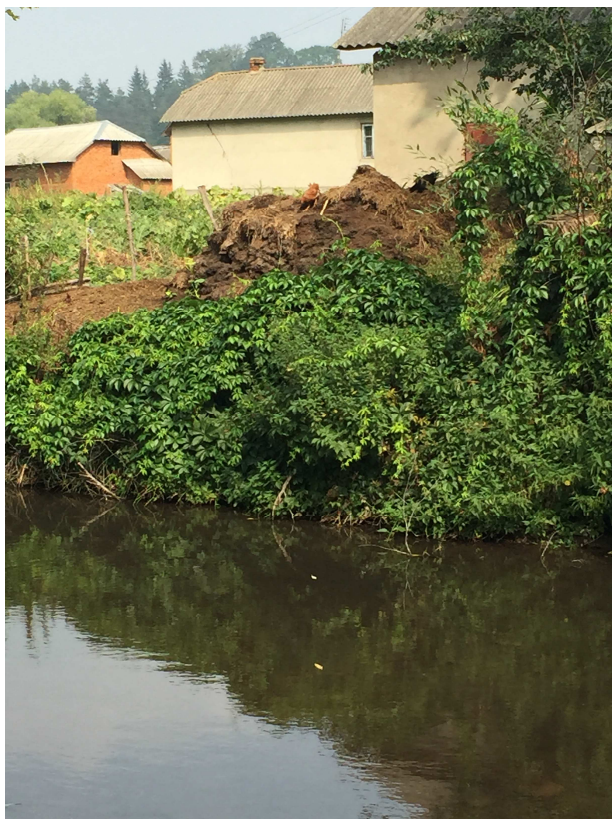
Рис.13. Екологічний стан прируслових ландшафтів в межах Кошилівської сільської ради.

Геоекологічна ситуація річкової долини більш сприятлива в Заліщицькому районі ніж у Чортківському за рахунок більшої частки лісів в структурі земельних угідь, каньйоноподібної долини річки і приуроченості населених пунктів до терас і вододілів.