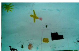
Мал. 1. Пауза

Цикл малюнків «Моя сім'я» ставить за мету діагностику сімейних відносин та психологічного клімату в сім'ї. Під час інтерпретації малюнків увага зверталась на розмір фігурок, їх розміщення у просторі відносно одна до одної, промальовування основних частин тіла, наявність (відсутність) на малюнку всіх членів родини, наявність додаткових елементів.