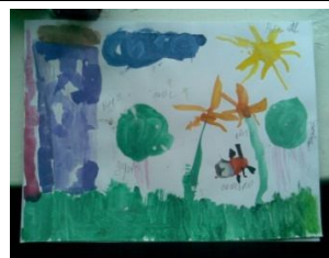
Мал. 13. Рима

На більшості малюнків зображені сонце, квіти, райдуга, дерева, дім (напр. мал. 12–13). Більшість дітей працювали з радістю та задоволенням. Деякі малюнки викликали досить сильний емоційний відгук у їх авторів. Наприклад, зображуючи червоним та чорним вулкан, магму та меч, хлопчик досить сильно хвилювався. Потім сказав, що намальоване ним – сон. Ймовірно, на малюнку знайшли вихід дуже сильні деструктивні переживання.