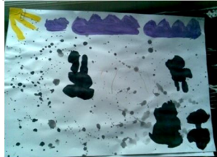
Мал. 9. Настя

На мал. 8 бачимо зображення дитини. Ймовірно, вона є здатною протистояти стресовим ситуаціям. Малюнок за кольоровою гамою справляє досить позитивне враження. Можемо припустити, що хоч в сім'ї наявна ситуація напруги (калюжі на малюнках часто позначають стресові переживання, що тривають вже значний період часу), дитина вміє справлятися з нею, розраховуючи на своїх батьків (за аналітичним трактуванням, парасолька є символом батьківської підтримки: мати символічно передається зображенням куполу парасольки, батько – ручки).