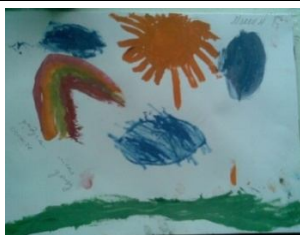
Мал. 12. Максим