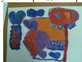
Мал. 17. Ілля

Почувши інструкцію, дівчинка почала відразу малювати (мал. 16). Працювала з захопленням. Відповідаючи на запитання після процесу малювання, зазначила, що їй сподобалось, сказала, що зобразила на своєму малюнку чарівну країну. Розповіла, що на минулий День Народження батьки подарували біле іграшкове цуценя, яке вона дуже любить.