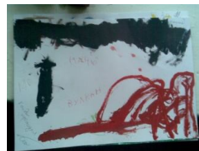
Мал. 14–15. Пашиа

Про наступну роботу автор малюнків 14–15 зазначив, що бачив подібний сюжет у мультфільмі. Досить деструктивний сюжет наступного малюнку (до великого ящику, про який зазначається, що у ньому мечі і сокири, під'єднаний динаміт; біля ящику стоїть войовничий робот) пояснив тим, що бачив подібну історію у мультфільмі (ймовірно, намагання раціоналізувати травмуючу ситуацію та агресивну реакцію на неї). Звертає увага репліка автору малюнка «щастя немає».