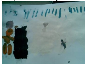
Мал. 11. Кирило

На мал. 9 бачимо зображення стресової ситуації, яка вже значно важче піддається контролю. Намалювавши фігури на малюнку, дівчинка потім зафарбувала їх чорною фарбою і пояснила це бажанням «заховати їх від дощу». Картина викликає досить тривожні відчуття, можна висунути припущення, що дівчинка пережила досить значний стрес. Щоб впоратись із ним, психіка застосувала механізм витіснення, «сховала» небажані спогади. У контексті аналізу малюнків Насті, доповнює картину інший її малюнок (мал. 10), на якому дівчинка зобразила себе, маму і тата (його фігура ледь промальована, супроводжувалась коментарем «папа сховав руки»). Ймовірно, дитина та її родина переживала дуже сильні стресові ситуації, від яких фактично не мала жодного захисту (дощ промальований не просто рясними краплями, а й камінням, що падає з небес; відсутні будь-які захисні елементи (капішон, парасолька)).