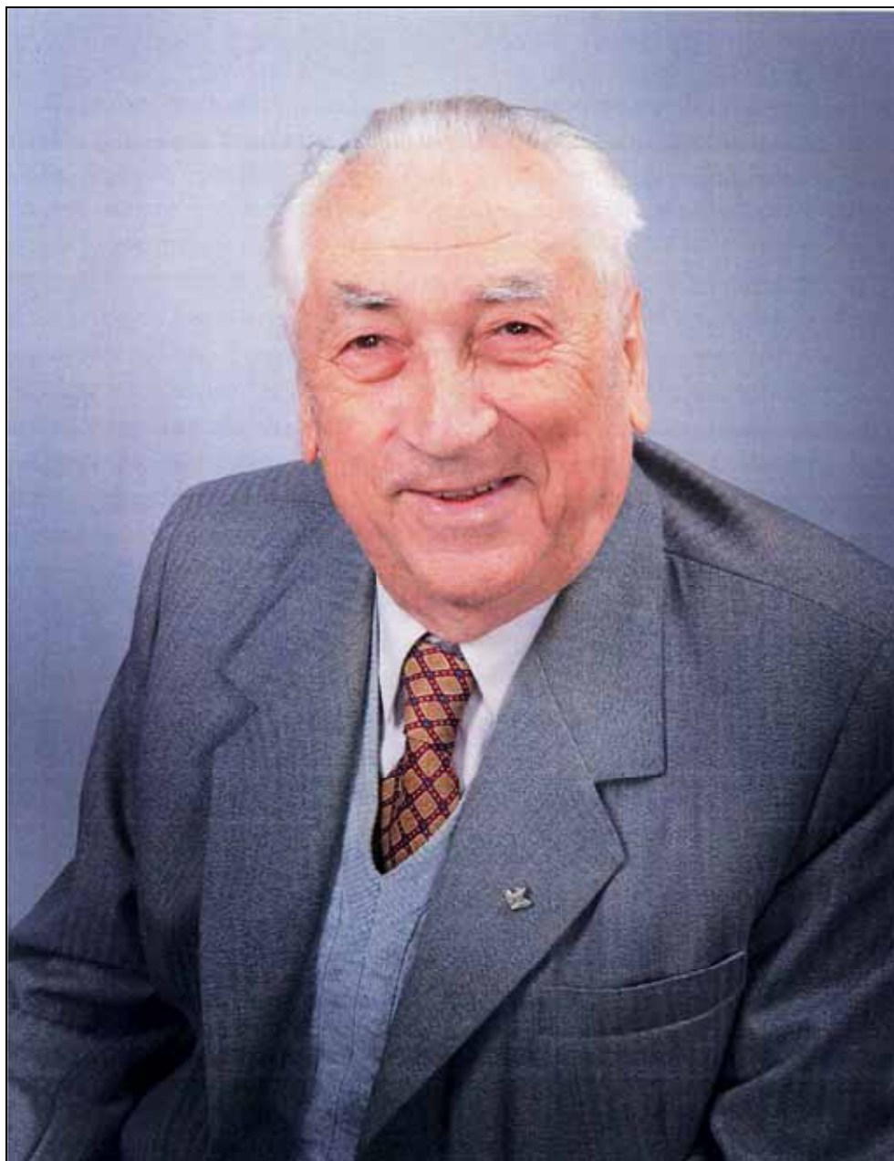
ПРОФЕСОР СТЕПАН МИХАЙЛОВИЧ СТОЙКО