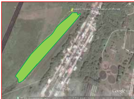
Рис.1. Картографічне поширення популяції Nasturtium officinale R. Br. -49°29'15" пн. ш., 25°34'51" сх. д.

Проби рослин відбирали з р.Серет, що протікає в межах Тернополя (рис. 1).