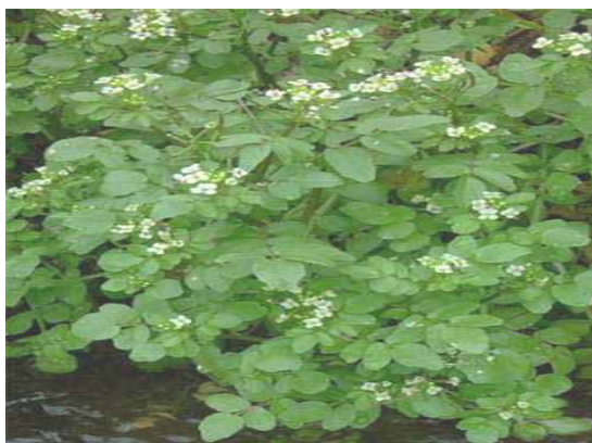
Рис.2. Фото з місця зростання N. officinale R. Br.

Для дослідження поглинальної здатності фосфатів із води був проведений модельний експеримент. Для цього із р. Серет в околицях м. Тернополя було відібрано Настурцію лікарську ( Nasturtium officinale R. Br.). Частину відібраних зразків рослин було поміщено у простерилізовані скляні ємності місткістю 10 дм 3 із водою з р. Серет, що прийняли за контроль (К). Для модельного досліду (Д) у річкову воду додавали розчин дигідрофосфату натрію (NaH 2 PO 4 ), в якому фосфор (Р) взятий у кількості 3,5 мг/дм 3 – концентрація, при якій елемент активно поглинається рослинами із води та рівномірно розподіляється у листі, стеблі та корені [3]. Експозиція рослин на розчинах та у природній воді тривала впродовж чотирьох місяців (з